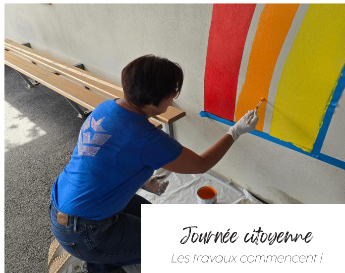
Journée citoyenne Les travaux commencent !