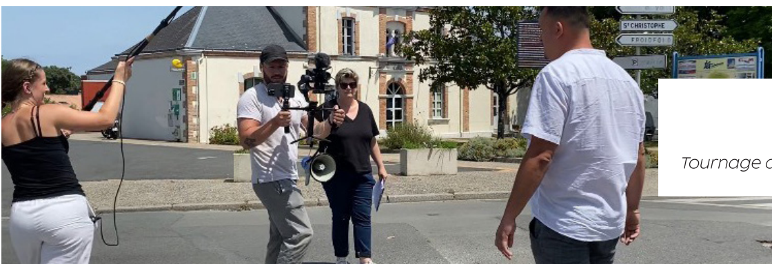
Action ! Tournage du prochain court-métrage