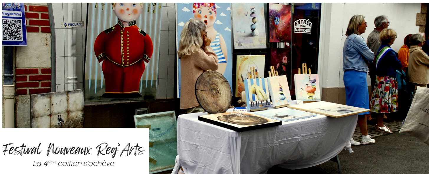
Festival Nouveaux Reg' Arts La 4 ème édition s'achève