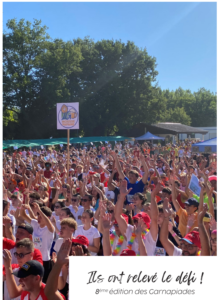
Ils ont relevé le défi ! 8 ème édition des Garnapiades