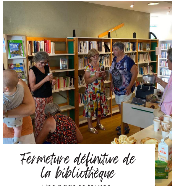
Fermeture définitive de la bibliothèque Une page se tourne...