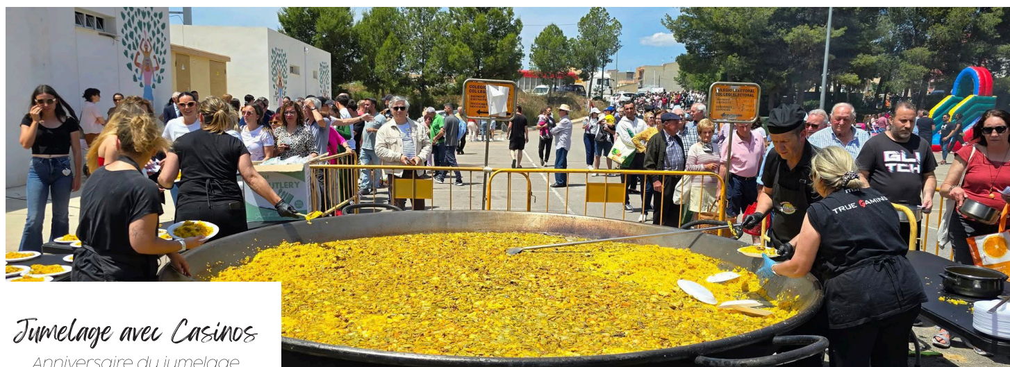
Jumelage avec Casinos Anniversaire du jumelage