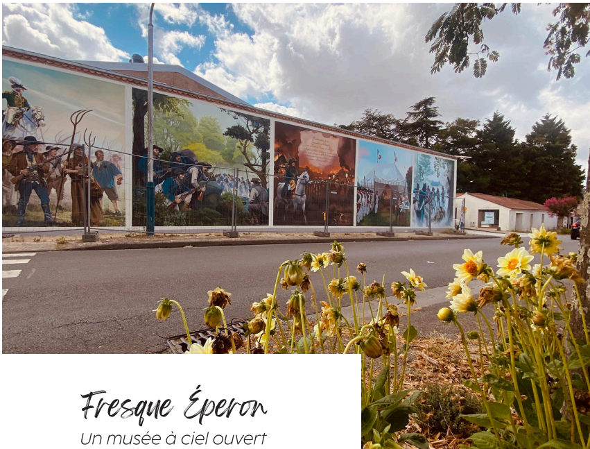
Fresque Éperon Un musée à ciel ouvert