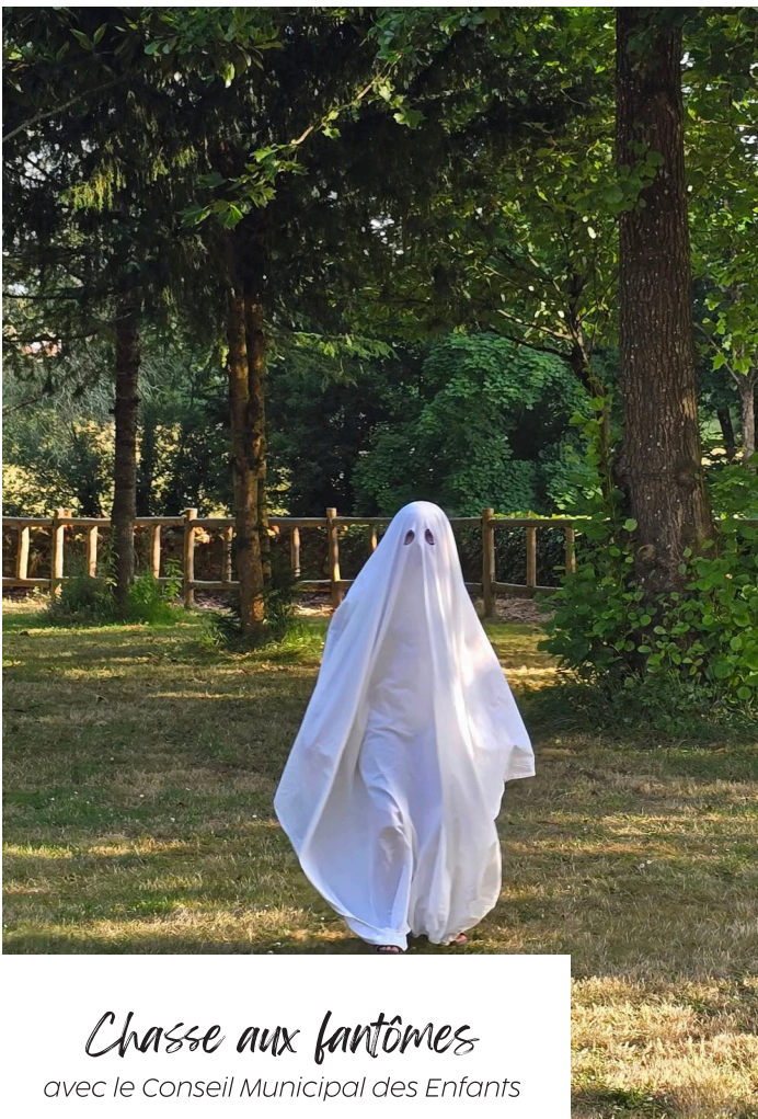
Chasse aux fantômes avec le Conseil Municipal des Enfants